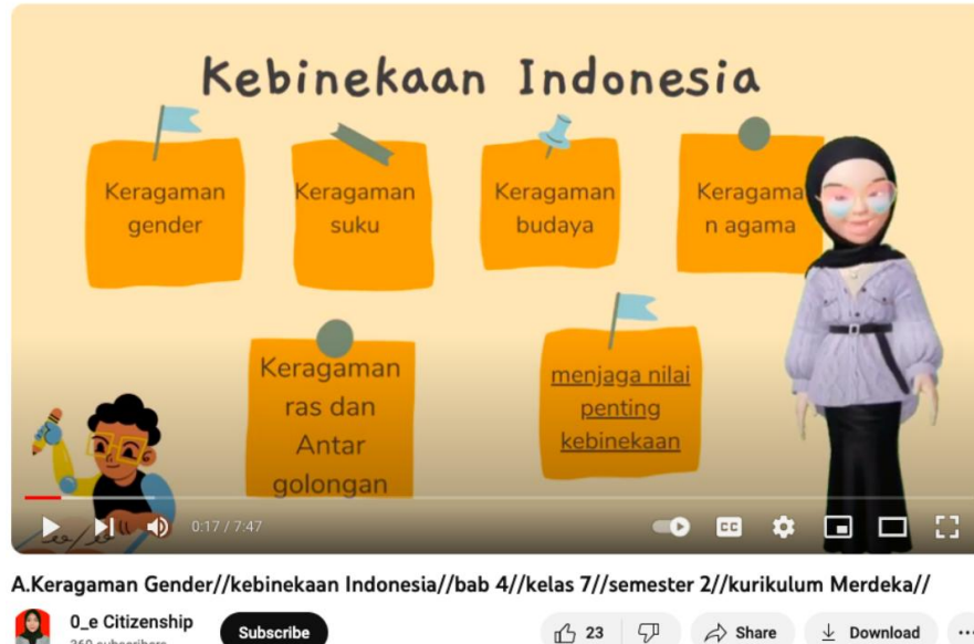
Gambar 3. Pembelajaran materi tentang gender di sekolah Setelah melihat isian materinya, penulis mengkritisi konten dari materi yang ada, dikarena pengetahuan tentang gender tidak dijelaskan

Dalam pendekatan ini, kurikulum merdeka bisa melakukan menerapkan secara jelas isu gender ke dalam mata pelajaran terkait. Dimana tawaran mata pelajaran tersebut diantaranya; 1) Studi Gender dalam pelajaran pendidikan agama bisa menggunakan konsep kajian islam gender menurut Nur Rofiah, 2) Studi Demokrasi dalam projek P5, 3) Pelajaran Sejarah yang juga mengangkat tentang kepemimpinan perempuan, dan 4) Pelajaran Pluralisme atau kebhinekaan dalam mata pelajaran PKN. Dalam kurikulum merdeka sendiri setelah penulis mencoba mencari informasi pada media youtube materi gender sudah ada yaitu di mapel PKN tentang Keragaman Gender dan kebhinekaan Indonesia pada Bab 4 kelas 7 semester 2, kurikulum Merdeka berikut link aksesnya. ( https://www.youtube.com/watch?v=RYroiL_UD-s )