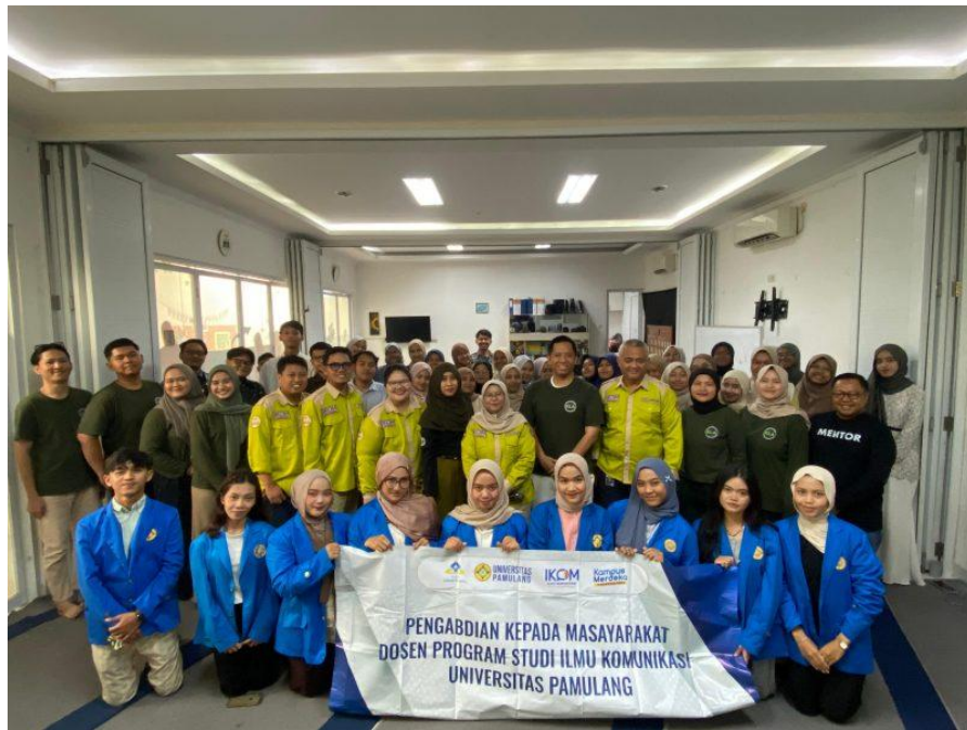
Gambar 2. Kegiatan PkM antara Komunitas Lantai Atas dan Universitas Pamulang

Hasil awal menunjukkan bahwa sebelum kegiatan dilaksanakan, sebagian besar peserta hanya memaknai media luar ruang sebatas tampilan visual yang menarik, warna mencolok, dan figur tokoh yang digunakan. Pesan persuasif, ideologi, serta kepentingan di balik media tersebut belum menjadi perhatian utama. Setelah mengikuti rangkaian kegiatan PkM, peserta mulai mampu mengidentifikasi tujuan pesan, sasaran audiens, serta strategi visual yang digunakan dalam media luar ruang seperti billboard , spanduk iklan, dan poster layanan publik.