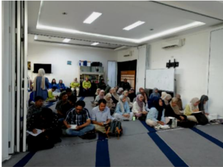
Gambar 3. Partisipasi Peserta dalam Diskusi

Lebih lanjut, kegiatan produksi pesan visual sederhana yang dilakukan peserta memperlihatkan bahwa literasi visual tidak berhenti pada tahap membaca dan mengkritisi, tetapi juga mencakup kemampuan mencipta. Dengan memproduksi pesan visual alternatif, peserta belajar memahami etika komunikasi, tanggung jawab sosial, serta pentingnya kesesuaian pesan dengan konteks budaya dan usia audiens. Ini menjadi langkah awal dalam membentuk generasi muda yang tidak hanya kritis sebagai konsumen media, tetapi juga bijak sebagai produsen pesan.