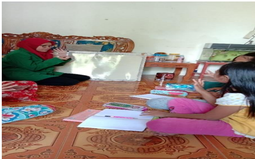
Gambar 1. Belajar Perkalian dan Pembagian Metode Jarimatika