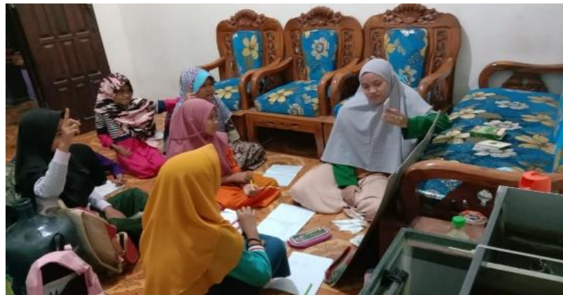
Gambar 2. Belajar Bahasa Inggris Menggunakan Flashcard