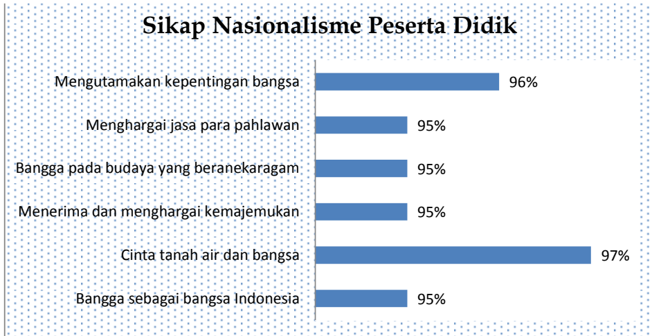
Grafik 3. Dampak Persepsi Guru Tentang Konsep Islam Berwawasan Rahmatan Lil Alamiin Terhadap Sikap Nasionalisme Pelajar

Dalam survey ini, yang dimaksud nasionalisme terdapat 7 (tujuh) indikator meliputi; bangga sebagai bangsa Indonesia, cinta tanah air dan bangsa, menerima dan menghargai kemajemukan, bangga pada budaya yang beraneka ragam, menghargai jasa para pahlawan dan mengutamakan kepentingan bangsa. Adapun hasil survey diperoleh data sebagai berikut: