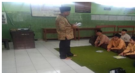
Gambar 6. Guru menilai tugas

Guru mengajukan pertanyaan yang relevan dengan materi baik lisan maupun tulisan, kemudian jika yang berhasil kurang dari 75 % maka tugas guru mengulang materi Al-Qur'an, Untuk memperkaya wawasan guru menambah bahan evaluasi melalui pemberian tugas seperti membuat kliping, makalah terkait materi Al-Qur'an Holy. Penilaian dibutuhkan guna mengetahui sejauh mana keberhasilan dicapai, untuk tindak lanjut, Penilaian pembelajaran Al-Qur'an bertujuan agar nilai Islami dapat terwujud secara maksimal dengan menggunakan tes lisan, tulisan maupun kinerja. 20