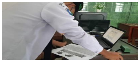
Gambar 10. Latihan pengoperasian Holy Qur'an

Caranya dengan memfungsikan icon tayangan sehingga muncul surat yang akan dibaca dengan mengklik icon bintang, selain itu icon tayangan juga menampilkan makna atau terjemahan ayat Al-Qur'an, membunyikan dengan nada syekh, kemudian tafsir Al-Qur'an.