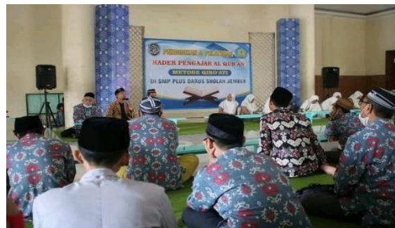
Gambar 8. Pelatihan Kader Guru Al Qur'an

Guna menjadi guru luar biasa maka dibutuhkan dukungan berupa pelatihan-pelatihan dari sekolah seperti Pelatihan kader pengajar Al-Qur'an dengan metode Qiro'ati sehingga guru Al-Qur'an benar-benar mendalami materi BTA (Baca Tulis Al-Qur'an).