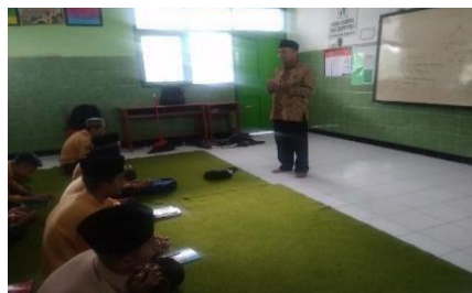
Gambar 1. Pembacaan Sholawat

Guru bertugas role model (teladhan) benar - benar berjiwa spiritual baik kepada Allah, sesama dan lingkungan, dengan mencotohkan akhlaq baik seperti guru mengambil wudhu sebelum mengajar kemudian mengajar dengan mengawali pembacaan Asmaul husna, ayat Al Qur'an dan solawat.