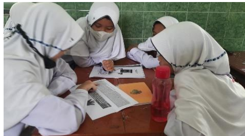
Gambar 5. Tutor per teaching

Administrator berarti penyelenggara pembelajaran runtut sesuai diktat, RPP. Pada awal pembelajaran Al Qur'an guru mengabsen kehadiran kemudian menjelaskan materi dan barulah mempraktikkan melalui aplikasi, adapun bentuk soal ulangan diberikan sama semua kelas sesuai jenjang. Dalam direktor , guru menjadi pengarah proses pembelajaran Al Qur'an atau jalannya pembelajaran dengan menggunakan metode drill, imla'. dan tutor per teaching .