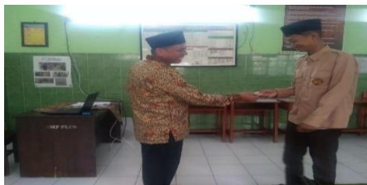
Gambar 3. Pemberian Reward

Pada kegiatan pembelajaran Al Qur'an siswa butuh yang namanya rangsangan semangat belajar untuk dirinya, Pembelajaran Al Qur'an membutuhkan konsentrasi tinggi untuk itu pendidik yang baik selalu memberikan motivasi dalam pembelajaran agar siswa lebih semangat dalam belajar, motivasi yang diberikan guru bukan hanya wejangan atau nasihat namun hadiah atau reward bagi siswa rajin dan berprestasi, pushiment atau hukuman positif seperti hafalan, tugas tambahan dan mengaji juga menjadi tugas pendidik dalam pembelajaran Al Qur'an.