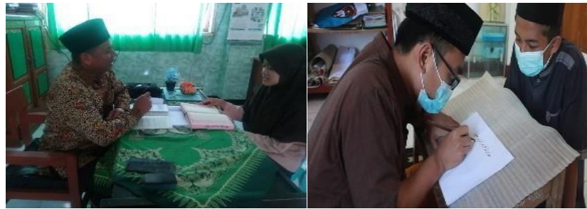
Gambar 7. Guru melatih Baca Tulis Qur'an (Intelektual)

Guna menjadi guru luar biasa maka dibutuhkan dukungan berupa pelatihan-pelatihan dari sekolah seperti Pelatihan kader pengajar Al-Qur'an dengan metode Qiro'ati sehingga guru Al-Qur'an benar-benar mendalami materi BTA (Baca Tulis Al-Qur'an).