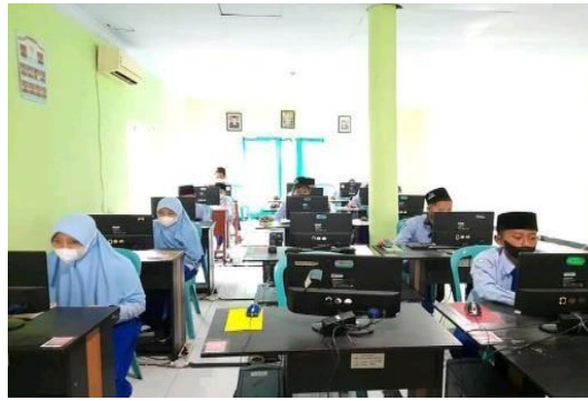
Gambar 2. Kegiatan Fasilitator Pembelajaran Al-Qur'an