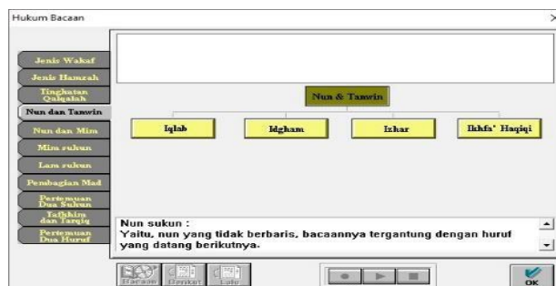
Gambar 12. Tampilan Menu Tajwid

Dalam aplikasi guru juga melatih ilmu tajwid lengkap hukum, sifat beserta keterangannya dengan cara siswa diperintahkan atau diajarkan langsung pada menu bacaan memuat seputar tajwid, biasanya ketika membaca guru menanyakan ayat-ayat langsung agar bisa mencari bagian menu bacaan tersebut.