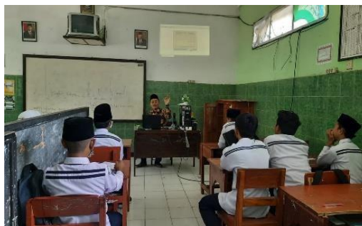
Gambar 4. Guru menjelaskan materi

Materi pelajaran yang diajarkan guru Al Qur'an ini tidak selalu bersumber buku atau diktat saja namun juga memanfaatkan internet melalui aplikasi yang ada dan menyesuaikan metode. Pembelajaran Al Qur'an dilaksanakan dengan menjelaskan materi kemudian diskusi serta praktik Al Qur'an menggunakan aplikasi Holy Qur'an, guru dalam mengajar dengan melalui kompetensi yakni kemampuan penguasaan materi