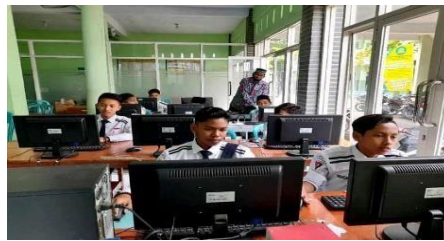
Gambar 9. Guru melatih Pengoperasian Al Qur'an Holy

Aplikasi Program Holy Qur'an release 6,5 Plus yaitu software atau perangkat lunak program komputer yang isinya pembelajaran Al-Qur'an dengan beberapa fasilitas seperti: isi keseluruhan ( Kaffah ), Al-Qur'an 30 juz baik berupa tulis maupun suara, thema (makna dan terjemah), tafsir, makhorijul huruf sampai tajwid lengkap, mencari ayat dalam Al-Qur'an, mencari ayat dengan tema, kitab hadits Bukhari Muslim, dan lainnya. 23