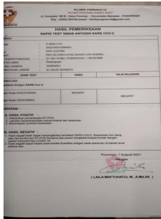
Gambar 3. Contoh Surat Tes Swab Antigen Calon Pengantin

Berdasarkan hasil wawancara, dan dokumentasi tersebut diketahui bahwa rumusan kebijakan yang diambil oleh Kepala KUA telah disahkan. Rumusan kebijakan baru dipandang final setelah disahkan peserta perumusan kebijakan formal. Pengesahan atau legalitas adalah suatu konstitusional alternatif pemecahan masalah terpilih yang selama ini diupayakan. 50