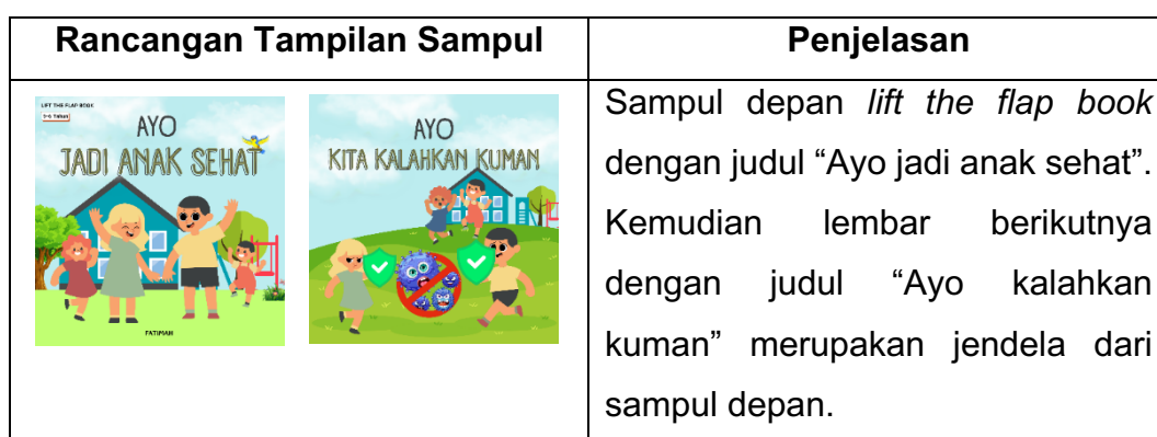
Tabel 1 Rancangan awal media lift the flap book

Secara teoretis dan teknis, pengembangan media ini merujuk pada Panduan Penulisan Buku Cerita Anak oleh Bambang Trimansyah serta Peraturan Badan Standar, Kurikulum, dan Asesmen Pendidikan Nomor 30 Tahun 2022 tentang Pedoman Penjenjangan Buku. Dari segi karakteristiknya, media lift-the-flap book (buku berjendela) dipilih karena memiliki tampilan unik yang dengan halaman tertentu yang bisa dibuka-tutup untuk menyimpan kejutan informasi visual atau teks di baliknya. Sejalan dengan teori Rahmawati, media ini tidak hanya berfungsi menyalurkan pengetahuan secara efektif, tetapi juga mampu memancing respons motorik halus sekaligus meningkatkan minat membaca anak hingga akhir halaman. 21