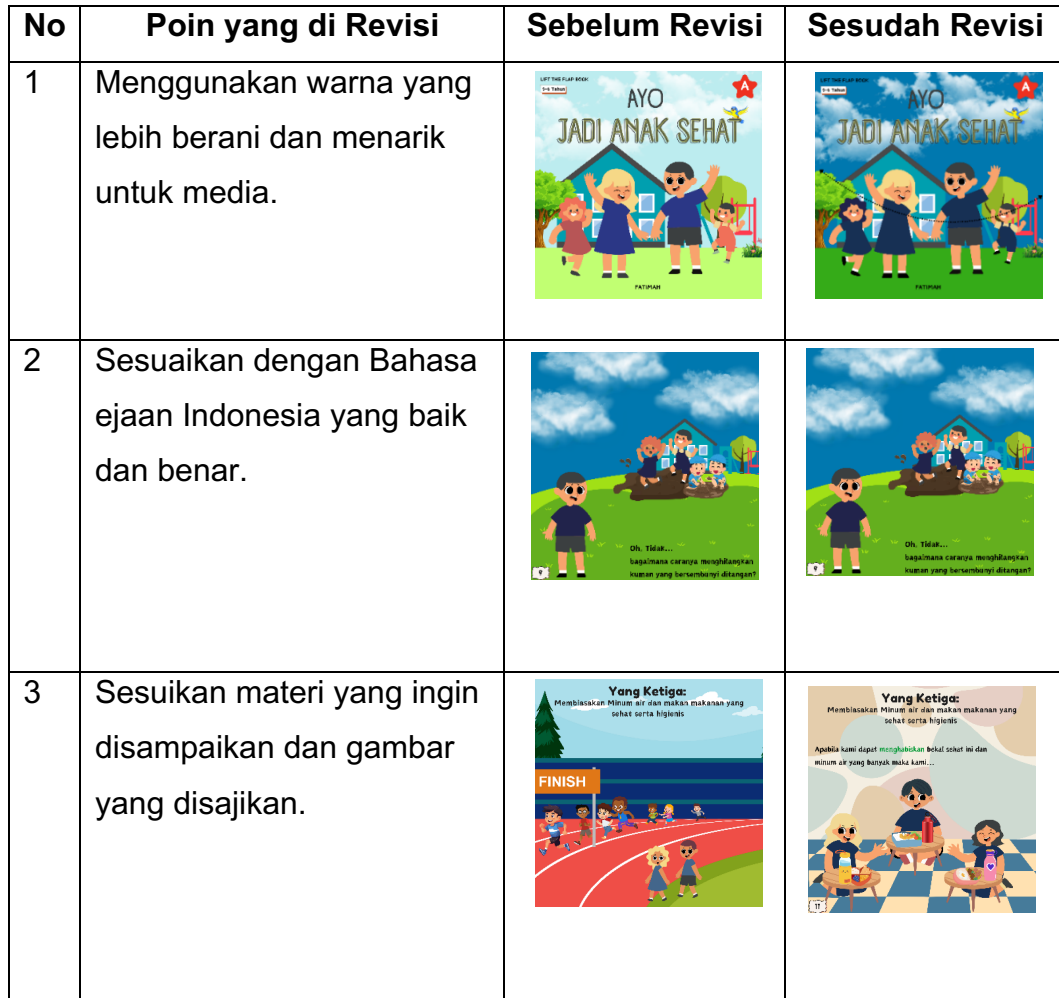
Tabel 5 Perbaikan desain berdasarkan masukan dari validator

Setelah memperbaiki media secara menyeluruh berdasarkan masukan validator pada evaluasi tahap pertama, peneliti mengajukan kembali prototipe media tersebut untuk validasi tahap kedua. Langkah ini bertujuan untuk memverifikasi ulang tingkat kelayakan akhir produk sebelum diujicobakan di lapangan. Data rekapitulasi perolehan skor pada validasi tahap kedua tersebut disajikan pada tabel berikut: