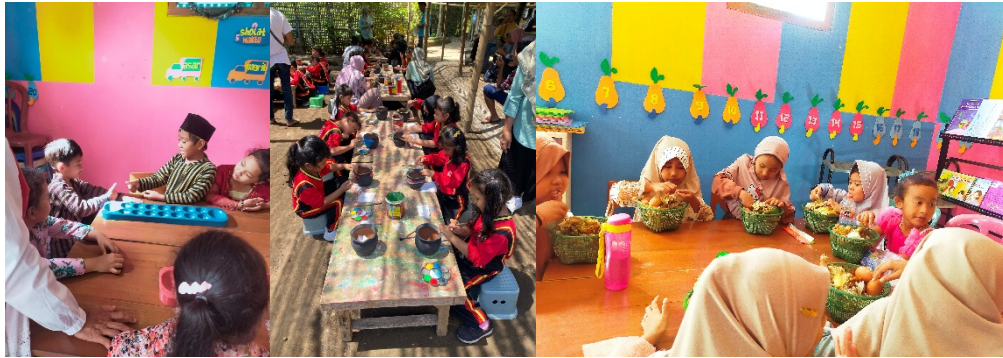
Gambar 2. Kegiatan Literasi Budaya dan Kewargaan

Pembahasan mengenai penerapan bahasa Jawa sebagai sarana literasi budaya dan kewargaan pada anak usia dini di TK PKK Gununggede 02 menunjukkan bahwa faktor lingkungan bahasa, baik di sekolah maupun di rumah, memainkan peran penting dalam pembentukan karakter dan keterampilan berbahasa anak. Anak di TK PKK Gununggede 02 lebih sering menggunakan bahasa Indonesia dalam komunikasi sehari-hari, sementara penggunaan bahasa Jawa, terutama Krama Inggil, semakin berkurang. Untuk mengatasi hal ini, pembelajaran bahasa Jawa perlu dikemas dengan metode yang menyenangkan, seperti melalui permainan tradisional, tembang dolanan, dan cerita rakyat. Pendekatan ini sejalan dengan temuan sebelumnya yang menekankan pentingnya penggunaan bahasa Jawa dalam komunikasi sehari-hari anak usia dini untuk melestarikan budaya dan meningkatkan keterampilan berbahasa mereka. 24