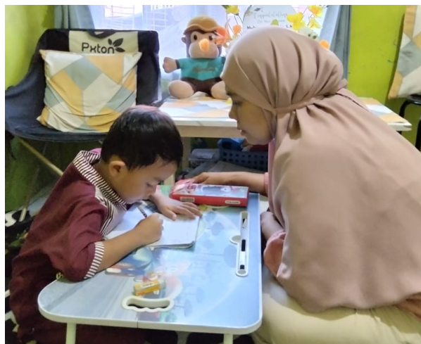
Gambar 2. Pendampingan belajar dirumah