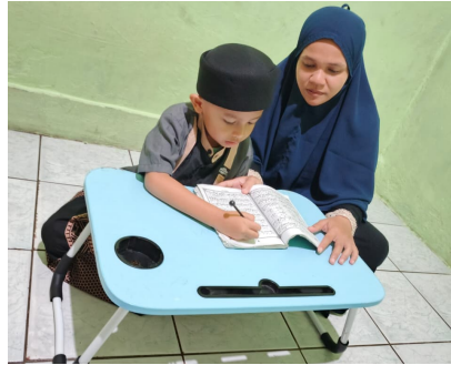
Gambar 4. Pendampingan religius