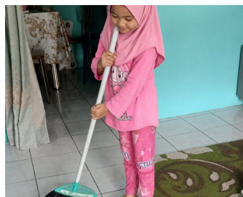
Gambar 3. Sikap keteladanan dari orang tua