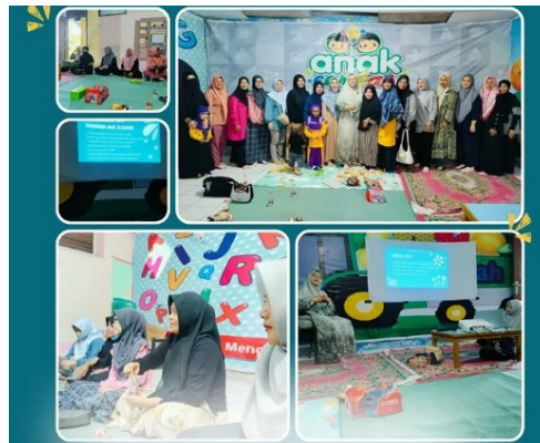
Gambar 5. Kolaborasi dengan orang tua (parenting)