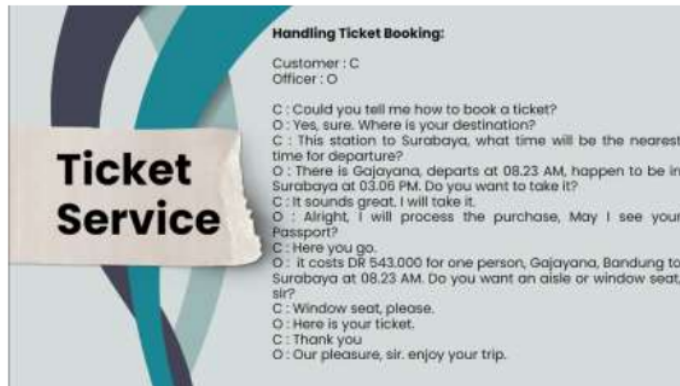
Gambar 4. Contoh percakapan dalam konteks pemesanan tiket

yang memuat percakapan tentang materi yang telah disiapkan dan disesuaikan dengan kondisi riil pelayanan penumpang di lapangan.