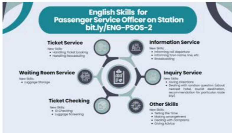
Gambar 3. Materi ajar bermuatan TCPM

Materi pembelajaran dalam program pengabdian masyarakat ini meliputi dua aspek utama tujuan pembelajaran yaitu Oral Presentation /Presentasi verbal dan Social Literacy /keterampilan interpersonal yang autentik dengan menyesuaikan kondisi riil lapangan. Untuk memenuhi tujuan pengembangan presentasi verbal, peserta didik diharapkan mampu mengumpulkan dan menyampaikan informasi yang relevan. Selanjutnya, untuk memenuhi tujuan pengembangan keterampilan interpersonal, peserta diharapkan mampu memberikan informasi dengan baik, mampu menangani konflik, serta mampu berkomunikasi secara efektif dan membangun hubungan dengan rekan kerja dan pelanggan (dalam hal ini penumpang kereta api cepat) secara profesional. Adapun materi untuk Program Pengabdian Masyarakat ini dapat diunduh pada tautan bit.ly/ENG-PSOS-2 dan outline pembelajaran dapat dilihat pada gambar berikut ini.