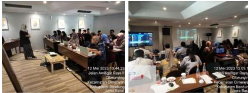
Gambar 2. Penyampaian tujuan pembelajaran dan pelaksanaan pre-test