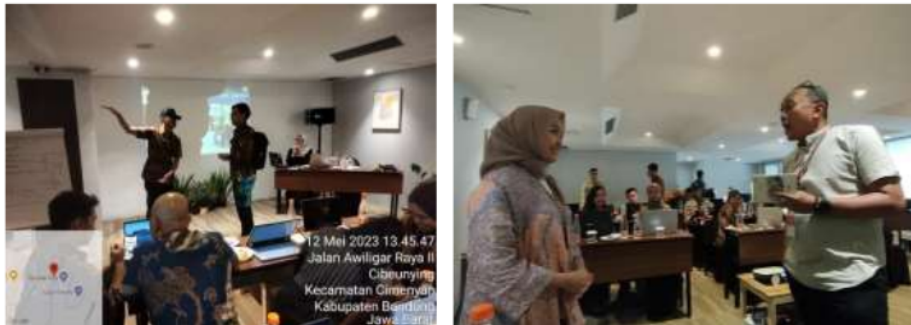
Gambar 5. Praktik melaksanakan role-play percakapan Bahasa Inggris dalam situasi riil

Setelah diberikan materi tentang beberapa gramatika dan kosakata teknis perkeretaapian serta beberapa rangkaian percakapan yang akan digunakan dalam melakukan pekerjaan sehari-hari sebagai petugas layanan penumpang, peserta membentuk kelompok dan memperagakan percakapan dalam bentuk role-play yang selanjutnya akan diperagakan di dalam kelas sebagai berikut.