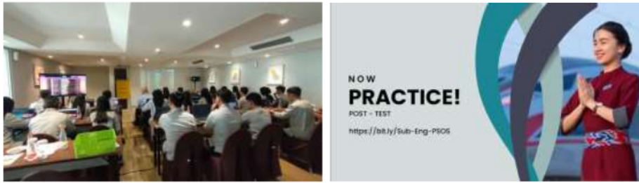
Gambar 6. Praktik/simulasi role-play sebagai bagian dari post-test

Hasil dari pengujian antara hasil pretest dan posttest (uji-t) menunjukkan nilai signifikansi (Sig.0,001), dimana jika hasil uji t < 0,05 maka H_a diterima, hal tersebut menunjukkan bahwa terdapat perubahan antara skor pretest dan posttest setelah diberi intervensi TCPM. Sehingga dapat disimpulkan bahwa materi bermuatan TCPM memiliki pengaruh terhadap peningkatan kemampuan bahasa Inggris teknis para petugas pelayanan penumpang. Selanjutnya, hasil dari praktik/simulasi menunjukkan bahwa metode praktik ini dapat meningkatkan kepercayaan diri untuk berbicara dalam Bahasa Inggris, hal ini ditunjukkan dengan tidak adanya peserta yang membawa teks selama proses assessment berlangsung.